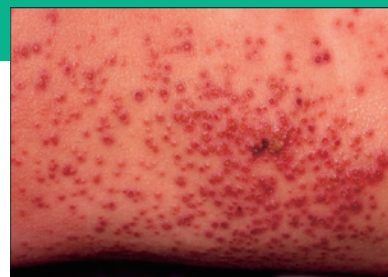
カポジ水痘様発疹症 (ヘルペス)