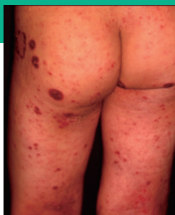
伝染性膿痂疹 (とびひ)

アトピー性皮膚炎でかかりやすい皮膚の感染症の場合は、抗生剤や抗ウイルス薬の内服、局所治療が必要なときがある