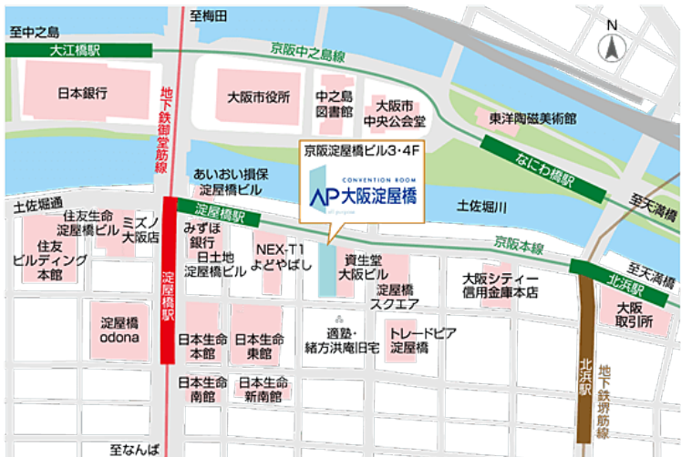
地下連絡通路ご案内図